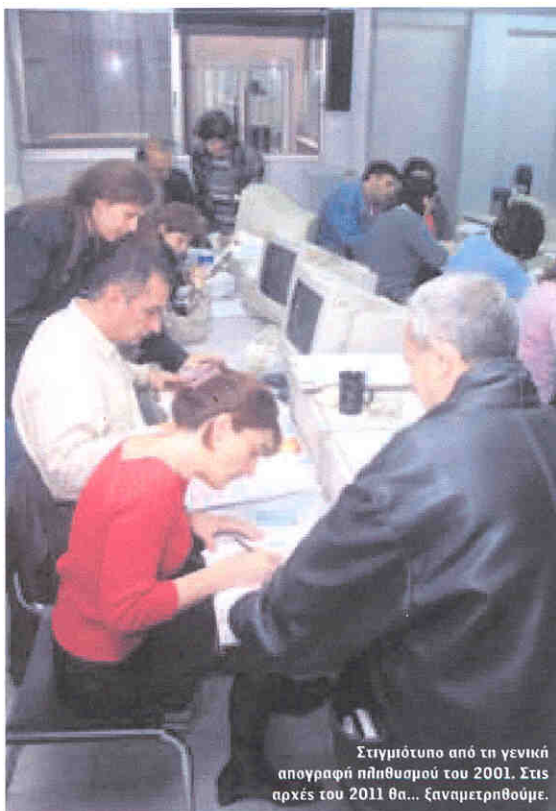
Στιγμιότυπο από τη γενική απογραφή πληθυσμού του 2001. Στις αρχές του 2011 θα... ξαναμετρηθούμε.

Από το 1853 μέχρι το 2001 ο πληθυσμός της Ελλάδας σταδιακά μετακινείται στα αστικά κέντρα, με συνέπεια την πλήρη ανατροπή των ποσοστών. Ενώ το 1853 το 79,4% ήταν κάτοικοι αγροτικών περιοχών, το 2001 οι έξι στους δέκα πολίτες είναι κάτοικοι αστικών κέντρων. Όπως υπογραμμίζουν χαρακτηριστικά και οι ερευνητές, «η μετακίνηση από τις ορεινές προς τις πεδινές περιοχές -και ταυτόχρονα από τις αγροτικές στις αστικές- χαρακτηρίζει τη σύγχρονη ιστορία της Ελλάδας». Την περίοδο 1920-1940 οι τάσεις αστικοποίησης επιβραδύνονται σημαντικά, ενώ επιταχύνονται εκ νέου την περίοδο της Κατοχής και του